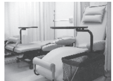
化学療法室ではフルフラット方式のリクライニングチェアでゆったりと治療を受けていただけます。

しかし、すべての方の吐き気・嘔吐を予防できているわけではありません。治療のためだからと我慢をせず、吐き気や嘔吐が起きたら、医療従事者にご相談ください。