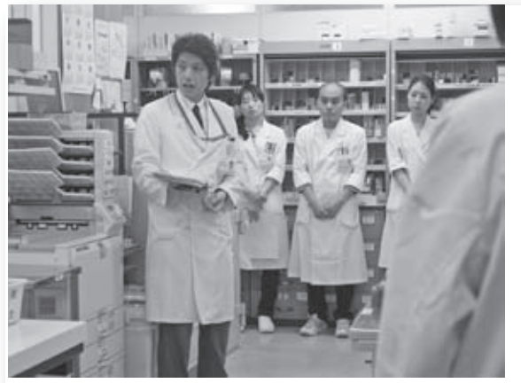
毎朝の朝礼で情報の共有を図ります