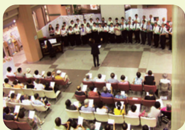
昨年のコンサート風景